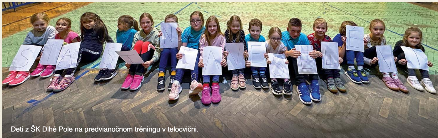
Deti z ŠK Dlhé Pole na predvianočnom tréningu v telocvični.