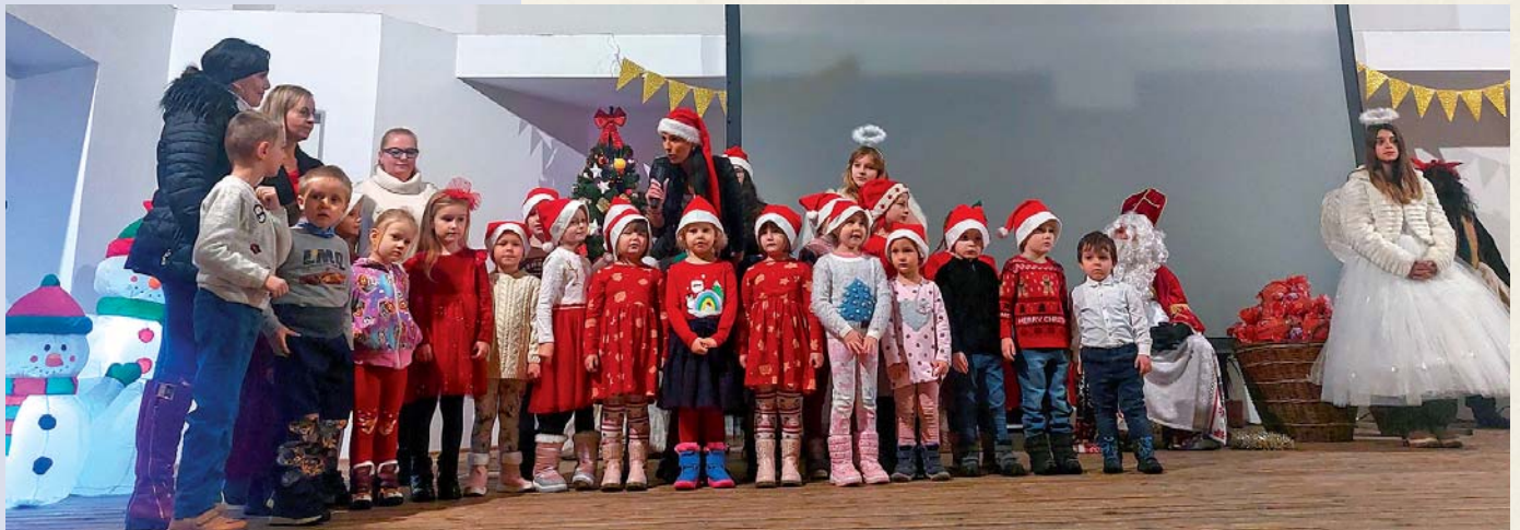
Mikuláša v kultúrnom dome privítali deti z materskej školy.