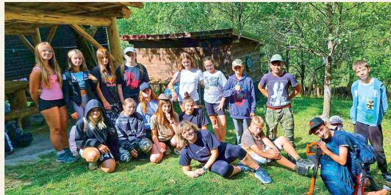
Siedmaci na „chatovačke“.