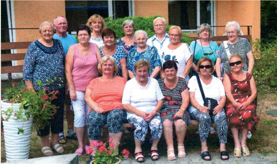
Členovia JDS na rehabilitačnom pobyte v Piešťanoch.

Naším hlavným cieľom v roku 2024 bolo obohacovať kultúrny život seniorov v obci. Momentálne máme 81 členov, z toho 62 žien a 19 mužov. V minulom roku sa prihlásilo 6 nových členov a 1 členka nás predišla do večnosti. Zaujímavé je aj naše vekové zloženie. Do 70 rokov máme 22 členov, od 70 do 85 je to 57 členov a do 90 rokov 2 členky. Naša členská základňa začína starnúť, roky pribúdajú a zdravie sa zhoršuje. Prácu ZO JDS riadi 7-členný výbor, ktorý minulý rok zasadal osemkrát. Predsedníčka ZO sa pravidelne zúčastňuje na zasadnutí OR JDS.