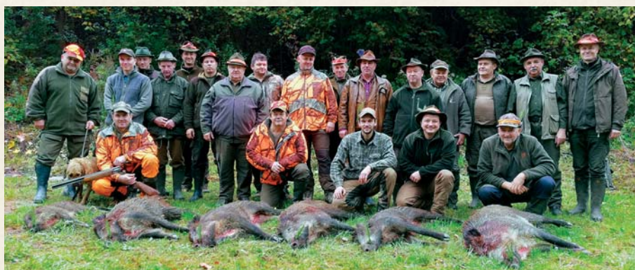
Spoločná poľovačka.