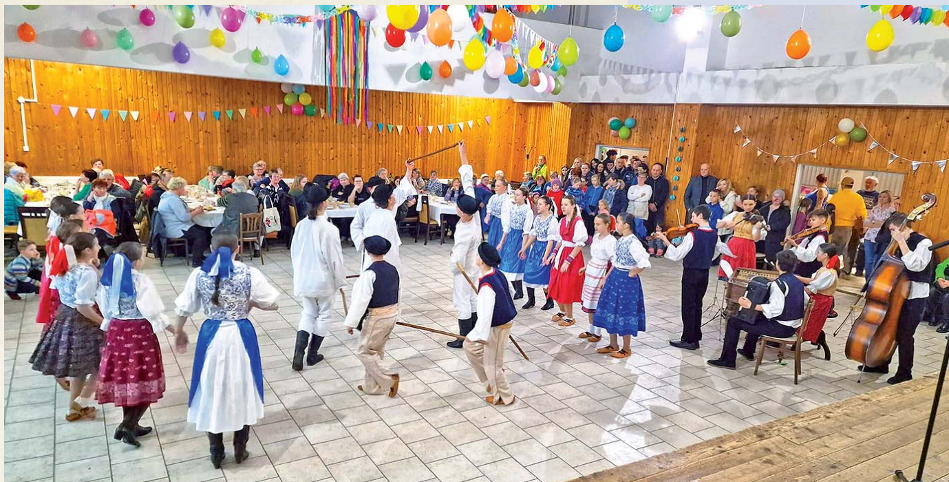
Dlhopol'ské fašiangovanie otvoril FS Lieska.