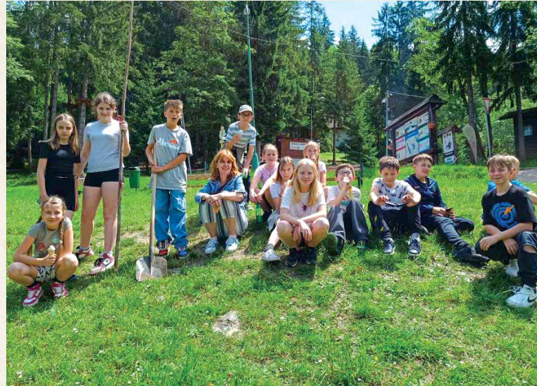
Piataci na výlete v okolí Ružomberka.