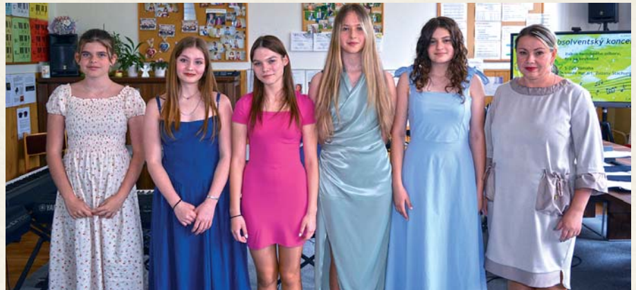
Absolventky S-ZUŠ Yamaha – Dlhé Pole v školskom roku 2023/2024.