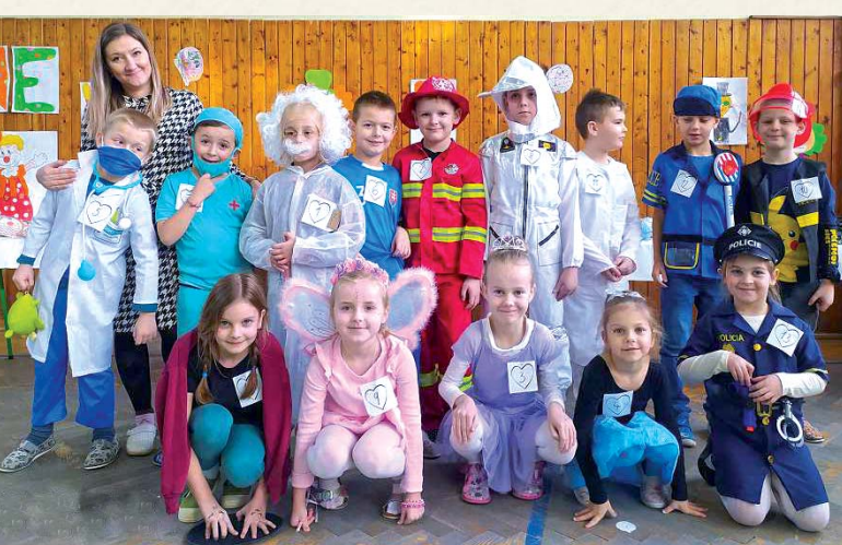
Karneval v telocvični potešil žiakov prvého stupňa.

Apríl bol venovaný aktivitám spojeným so životným prostredím. Žiaci si v rámci Dňa Zeme upratili okolie školy a deti navštevujúce ŠKD zažili dve zaujímavé aktivity. Najskôr ich navštívila členka neziskovej organizácie Zmysel života, ktorá