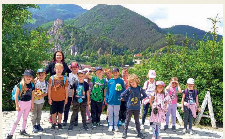
Prváci na výlete v Rozprávkovom lese.