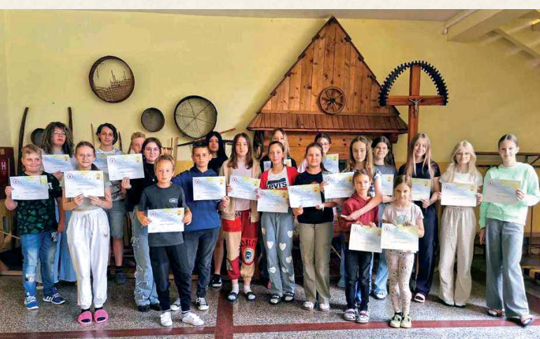
Počet účastníkov súťaže English Star stále stúpa.