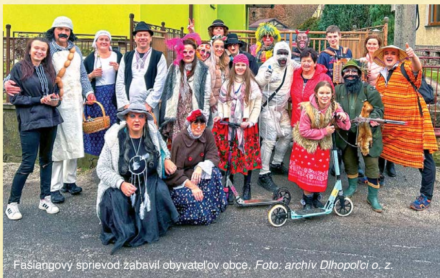
Fašiangový sprievod zabavil obyvateľov obce.