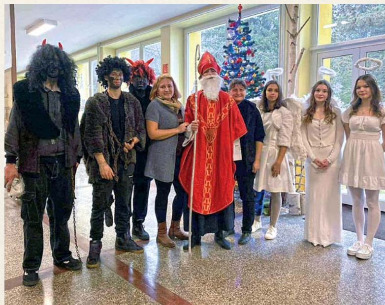
Mikulášsky deň v škole pripravili žiaci 9.A.