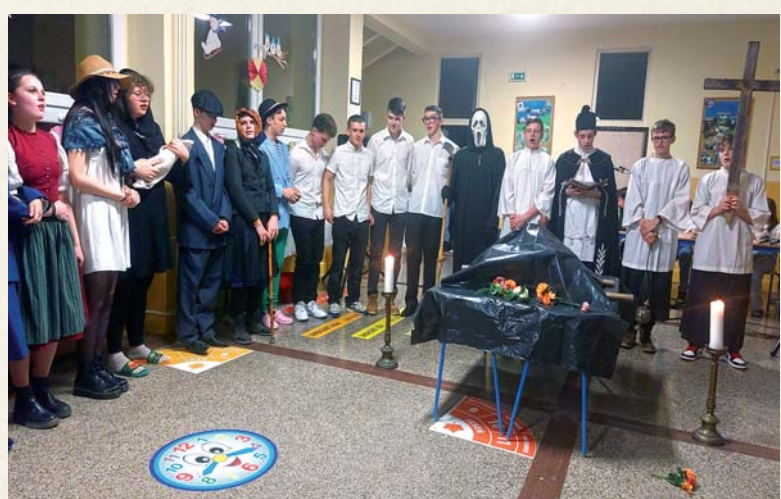
Pochovávanie basy v podaní žiakov 9. triedy.