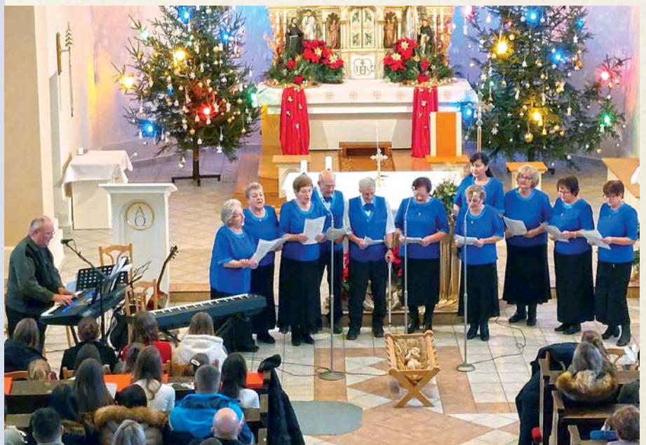
Na koncerte pri jasičkách v miestnom kostole zaspievala aj folklórna skupina Drotár.