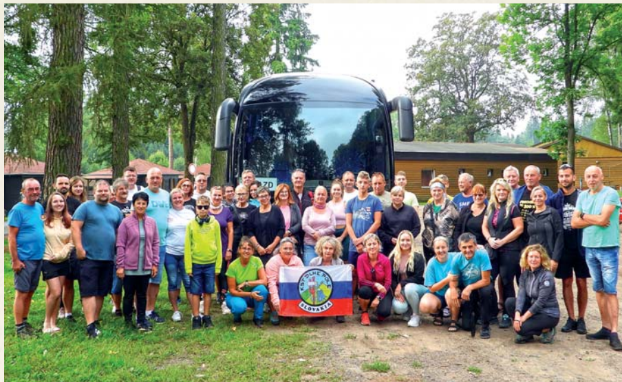
Autobusový zájazd do Českej republiky. Foto: archív KST Dlhé Pole