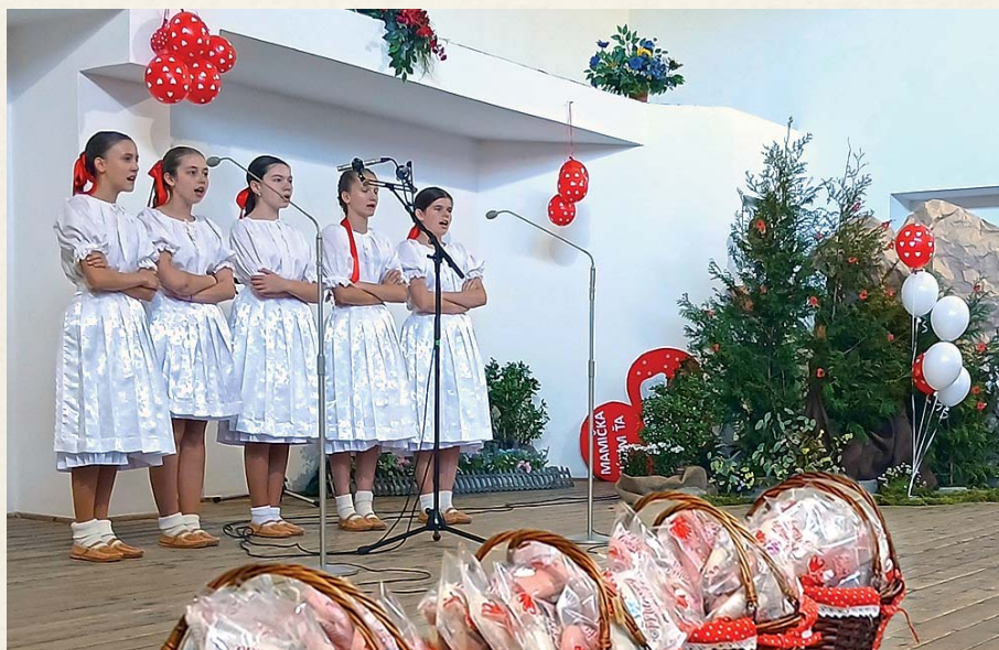
Na Deň matiek potešili svojim vystúpením dievčatá z DFS Srdiečko.