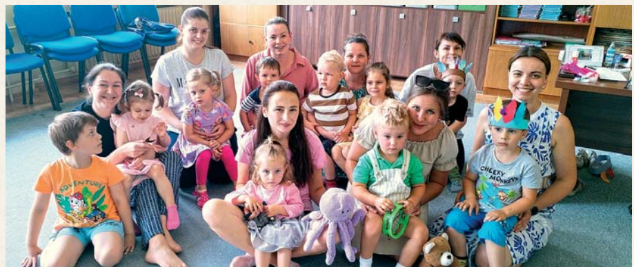
Predškolské programy – Prvé krôčiky k hudbe.