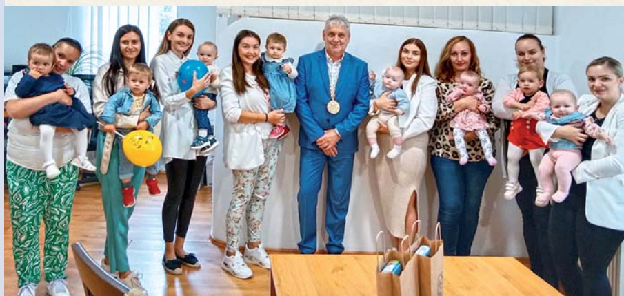
Spoločná fotografia počas Uvítania detí do života: Foto: archív OÚ