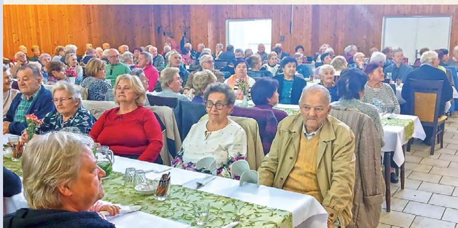
Na Stretnutí dôchodcov sa vždy stretne plno známych.

kolíske. Pri občerstvení sa mamy porozprávali a deti sa zoznámili s budúcimi spolužiakmi a kamarátmi. Najväčšiu radosť však mali z balónovej výzdoby.