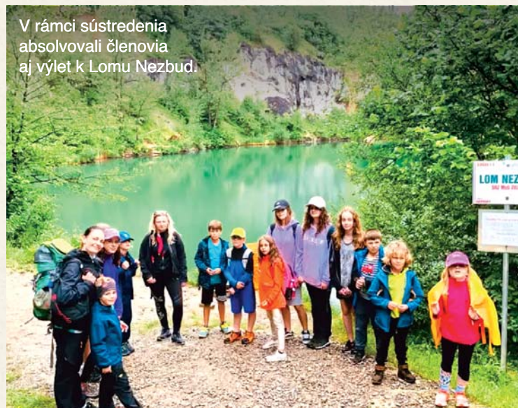
V rámci sústredenia absolvovali členovia aj výlet k Lomu Nezbud.