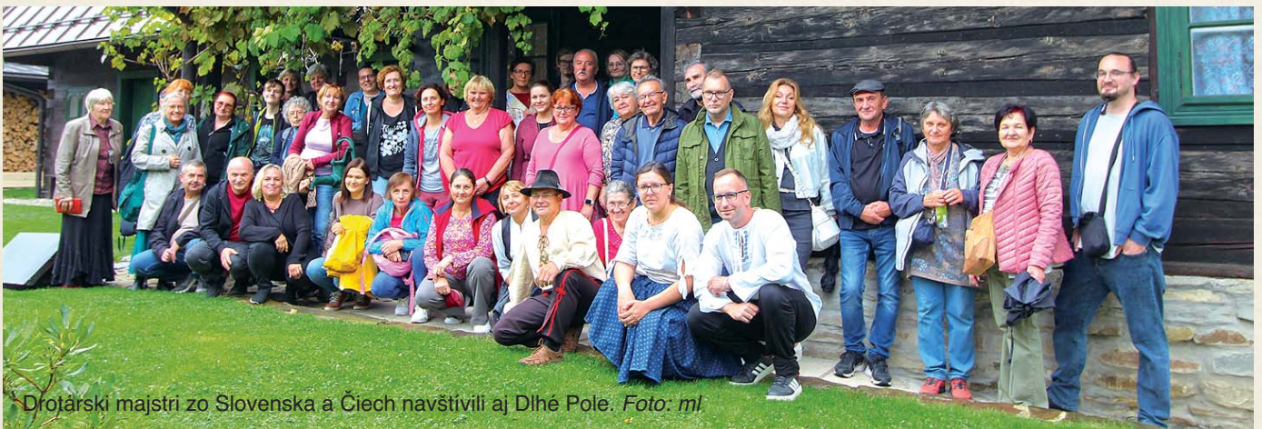
Drotárski majstri zo Slovenska a Čiech navštívili aj Dlhé Pole.