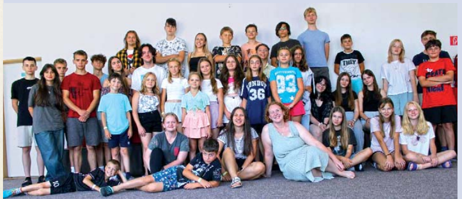
Na letný tábor sa všetci členovia eRka veľmi tešia.